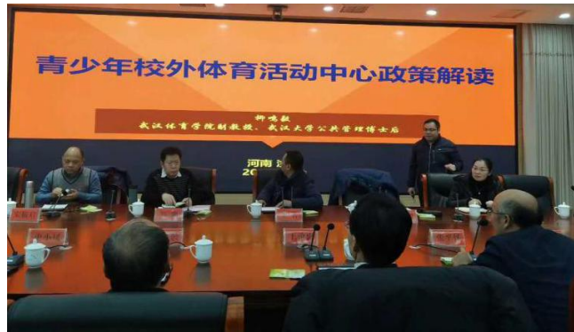
图1 青少年校外体育活动研讨会现场

2018年1月5日至1月7日，青少年科学运动与健康促进协同创新平台负责人柳鸣毅教授专家团队应邀参加汝州市青少年校外体育活动中心研讨会。汝州市人大常委会副主任王沧海、汝州市人民政府副市长张平怀、汝州市政协副主席韩自敬等领导以及汝州市教育界、体育界相关人员出席了此次会议。会议就《青少年校外体育活动促进计划》进行解读及未来发展提出建议对策。汝州市人大常委会副主任王沧海主持了此次会议。